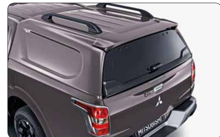
▲ Zabudowa bez szyb bocznych DC