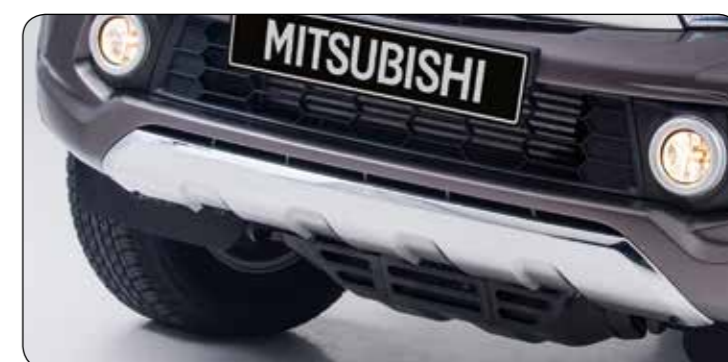
▲ Osłona zderzaka przedniego CC / DC Chromowana. MZ330739