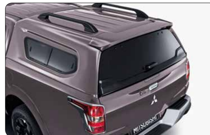
▲ Zabudowa z bocznymi szybami przesuwными DC