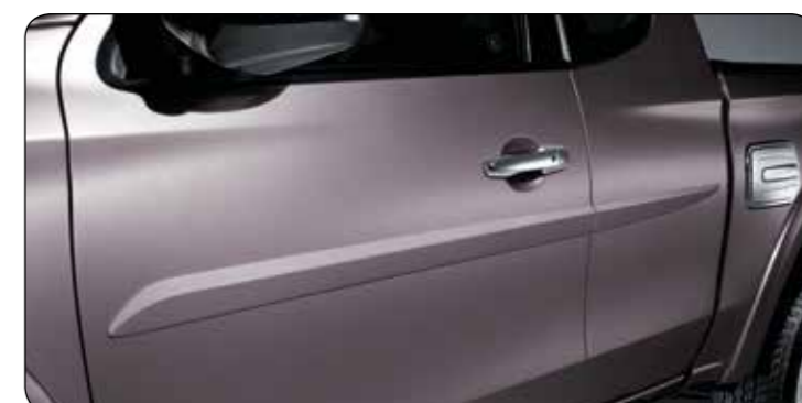
▲ Listwy ochronne drzwi CC Lakierowane w kolorze nadwozia, szukaj w wykazie numerów katalogowych.