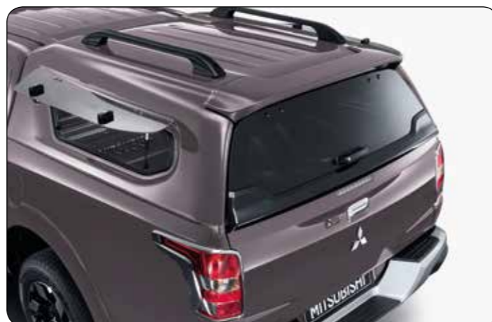
▲ Zabudowa z bocznymi szybami uchylnymi DC

Wszystkie oryginalne zabudowy Mitsubishi są wyposażone standardowo w tylny spojler oraz relingi dachowe o maksymalnej nośności 50 kg. Dostępne we wszystkich kolorach nadwozia. Szukaj w wykazie numerów katalogowych.