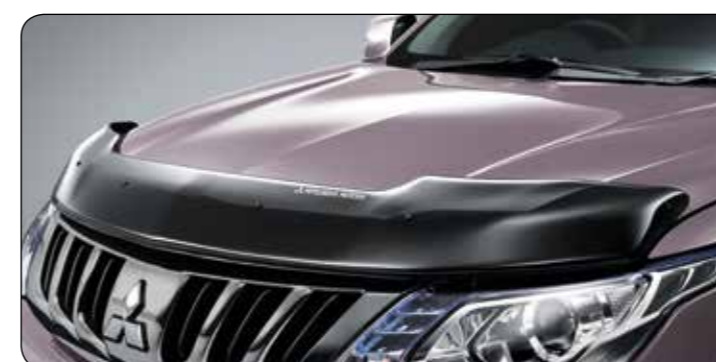
▲ Owiewka na pokrywę silnika CC / DC MZ330747