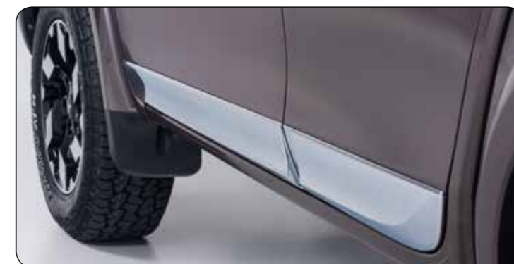
▲ Listwy ozdobne drzwi, dolne DC Chromowane. MZ330737