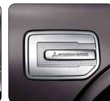
▲ Pokrywa wlewu paliwa CC Chromowana. MZ330735