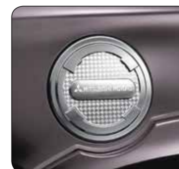
▲ Pokrywa wlewu paliwa DC Chromowana. MZ330734