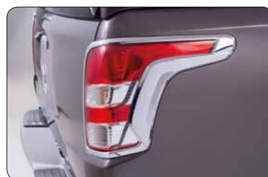
▲ Ramki ozdobne lamp tylnych CC / DC Chromowane. MZ330751