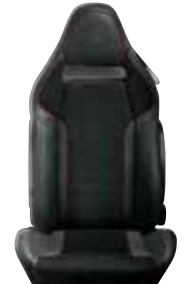
Czarne Sparco (opcja)

Cennik zawiera ceny detaliczne w złotych z VAT. Ceny zawierają podatek akcyzowy. Ceny mogą ulec zmianom bez uprzedniego zawiadomienia w przypadku zmian cen przez producenta, zmian podatkowych, przepisów celnych lub innych przyczyn. Wyposażenie seryjne i dodatkowe poszczególnych modeli może ulegać zmianom w zależności od potrzeb poszczególnych rynków i wymogów prawnych. Dane w niniejszym cenniku mają charakter orientacyjny i nie stanowią oferty w rozumieniu Kodeksu Cywilnego.