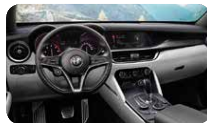
Deska rozdzielcza i panele drzwi czarno-białe