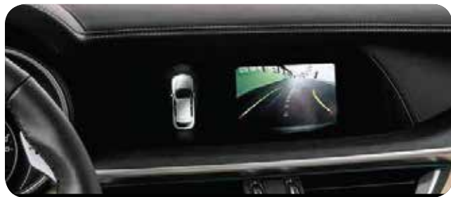
Pakiet Asystent kierowcy z tylną kamerą cofania

■ opcja standardowa; - opcja niedostępna