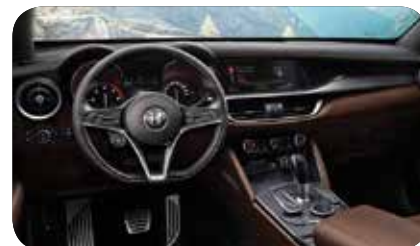
Deska rozdzielcza i panele drzwi czarno-brązowe

Cennik zawiera ceny detaliczne w złotych z VAT. Ceny zawierają podatek akcyzowy. Ceny mogą ulec zmianom bez uprzedniego zawiadomienia w przypadku zmian cen przez producenta, zmian podatkowych, przepisów celnych lub innych przyczyn. Wyposażenie seryjne i dodatkowe poszczególnych modeli może ulegać zmianom w zależności od potrzeb poszczególnych rynków i wymogów prawnych. Dane w niniejszym cenniku mają charakter orientacyjny i nie stanowią oferty w rozumieniu Kodeksu Cywilnego.