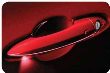
Bezkluczkowe otwarcie drzwi - keyless Entry

■ opcja standardowa; - opcja niedostępna