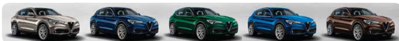
082 Titanio Imola