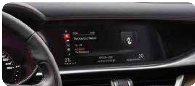
Radio U Connect z wyświetlaczem 8,8"

■ opcja standardowa; - opcja niedostępna