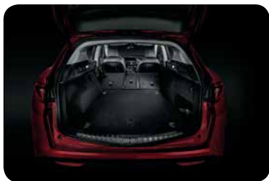
Pojemność bagażnika 525 litrów