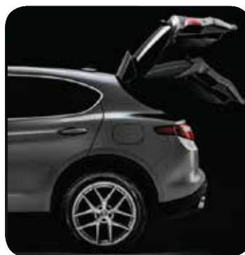
Tylna klapa bagażnika elektrycznie otwierana

Cennik zawiera ceny detaliczne w złotych z VAT. Ceny zawierają podatek akcyzowy. Ceny mogą ulec zmianom bez uprzedniego zawiadomienia w przypadku zmian cen przez producenta, zmian podatkowych, przepisów celnych lub innych przyczyn. Wyposażenie seryjne i dodatkowe poszczególnych modeli może ulegać zmianom w zależności od potrzeb poszczególnych rynków i wymogów prawnych. Dane w niniejszym cenniku mają charakter orientacyjny i nie stanowią oferty w rozumieniu Kodeksu Cywilnego.