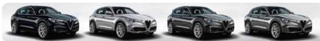
408 Czarny Nero Vulcano