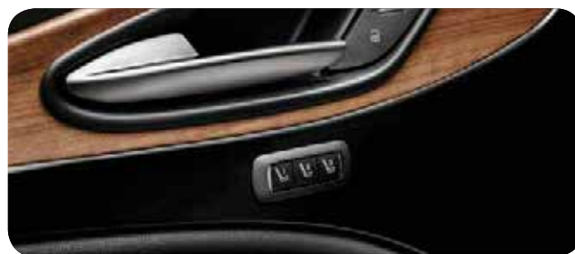
Pakiet Luxury, wykończenie wnętrza w drewnie brązowy orzech

Cennik zawiera ceny detaliczne w złotych z VAT. Ceny zawierają podatek akcyzowy. Ceny mogą ulec zmianom bez uprzedniego zawiadomienia w przypadku zmian cen przez producenta, zmian podatkowych, przepisów celnych lub innych przyczyn. Wyposażenie seryjne i dodatkowe poszczególnych modeli może ulegać zmianom w zależności od potrzeb poszczególnych rynków i wymogów prawnych. Dane w niniejszym cenniku mają charakter orientacyjny i nie stanowią oferty w rozumieniu Kodeksu Cywilnego.