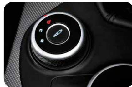
Zawieszenie aktywne Alfa Active Suspension

Cennik zawiera ceny detaliczne w złotych z VAT. Ceny zawierają podatek akcyzowy. Ceny mogą ulec zmianom bez uprzedniego zawiadomienia w przypadku zmian cen przez producenta, zmian podatkowych, przepisów celnych lub innych przyczyn. Wyposażenie seryjne i dodatkowe poszczególnych modeli może ulegać zmianom w zależności od potrzeb poszczególnych rynków i wymogów prawnych. Dane w niniejszym cenniku mają charakter orientacyjny i nie stanowią oferty w rozumieniu Kodeksu Cywilnego.