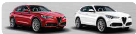
361 Czerwony Rosso Competizione