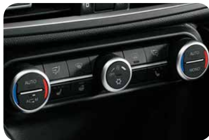
Pakiet zimowy: podgrzewane fotele przednie + podgrzewana kierownica