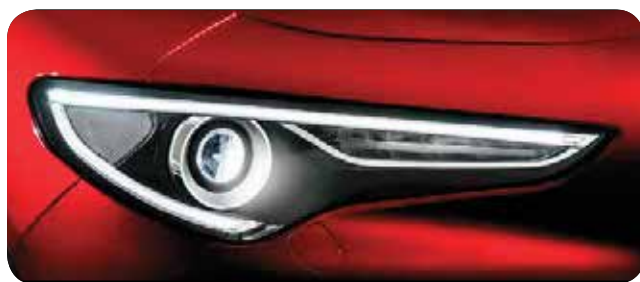
Pakiet Lighting ze światłami bi-xenon o mocy 35 Watt