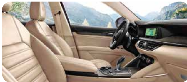
Pakiet Luxury z wnętrzem beżowym

Cennik zawiera ceny detaliczne w złotych z VAT. Ceny zawierają podatek akcyzowy. Ceny mogą ulec zmianom bez uprzedniego zawiadomienia w przypadku zmian cen przez producenta, zmian podatkowych, przepisów celnych lub innych przyczyn. Wyposażenie seryjne i dodatkowe poszczególnych modeli może ulegać zmianom w zależności od potrzeb poszczególnych rynków i wymogów prawnych. Dane w niniejszym cenniku mają charakter orientacyjny i nie stanowią oferty w rozumieniu Kodeksu Cywilnego.