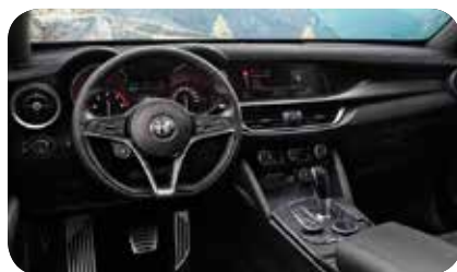
Deska rozdzielcza i panele drzwi czarno-czarne

■ opcja standardowa; - opcja niedostępna