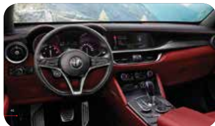
Deska rozdzielcza i panele drzwi czarno-czerwone