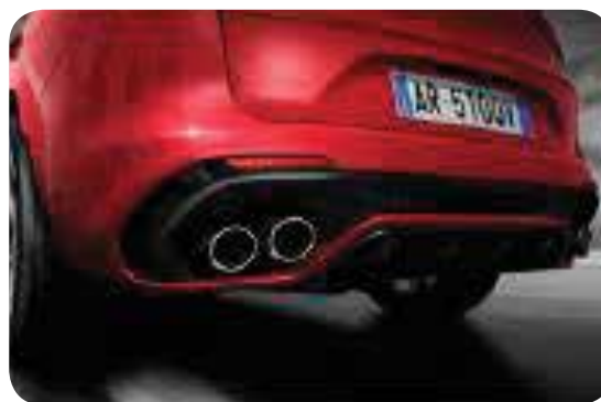
4 końcówki rury wydechowej z tylnym dyfuzorem

Cennik zawiera ceny detaliczne w złotych z VAT. Ceny zawierają podatek akcyzowy. Ceny mogą ulec zmianom bez uprzedniego zawiadomienia w przypadku zmian cen przez producenta, zmian podatkowych, przepisów celnych lub innych przyczyn. Wyposażenie seryjne i dodatkowe poszczególnych modeli może ulegać zmianom w zależności od potrzeb poszczególnych rynków i wymogów prawnych. Dane w niniejszym cenniku mają charakter orientacyjny i nie stanowią oferty w rozumieniu Kodeksu Cywilnego.