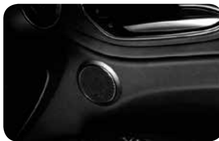
System HI FI by Harman Kardon

Cennik zawiera ceny detaliczne w złotych z VAT. Ceny zawierają podatek akcyzowy. Ceny mogą ulec zmianom bez uprzedniego zawiadomienia w przypadku zmian cen przez producenta, zmian podatkowych, przepisów celnych lub innych przyczyn. Wyposażenie seryjne i dodatkowe poszczególnych modeli może ulegać zmianom w zależności od potrzeb poszczególnych rynków i wymogów prawnych. Dane w niniejszym cenniku mają charakter orientacyjny i nie stanowią oferty w rozumieniu Kodeksu Cywilnego.