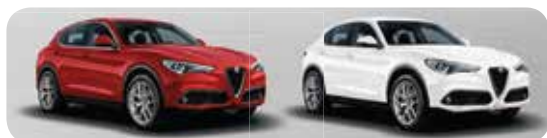
414 Czerwony Rosso Alfa